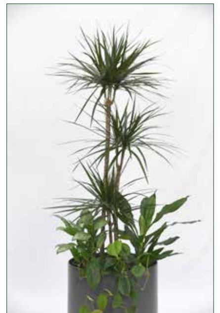
mittlerer Lichtbedarf, Dracaena marginata verzweigt 5.5.1.B25