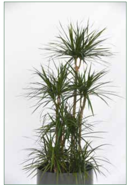
mittlerer Lichtbedarf, Dracaena marginata verzweigt 5.5.1.B27