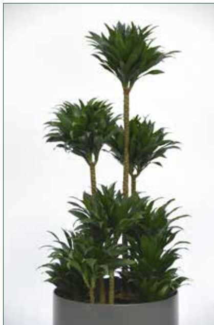
geringer Lichtbedarf, Dracaena Janet Craig compacta 5.5.1.B9