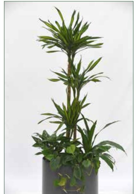
geringer Lichtbedarf, Dracaena riki 5.5.1.B13