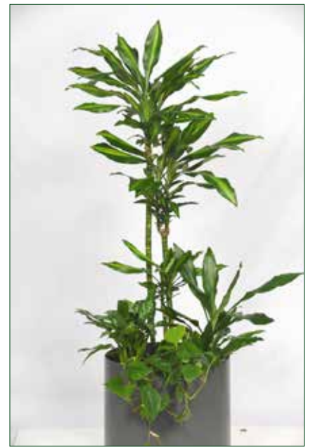
mittlerer Lichtbedarf, Dracaena cintho 5.5.1.B19