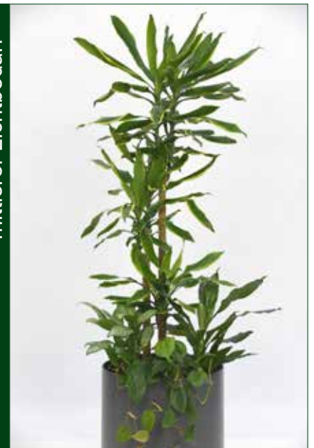
mittlerer Lichtbedarf, Dracaena Golden Coast 5.5.1.B16