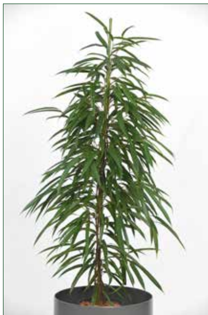
hoher Lichtbedarf, Ficus longifolium alii 5.4.1.A37