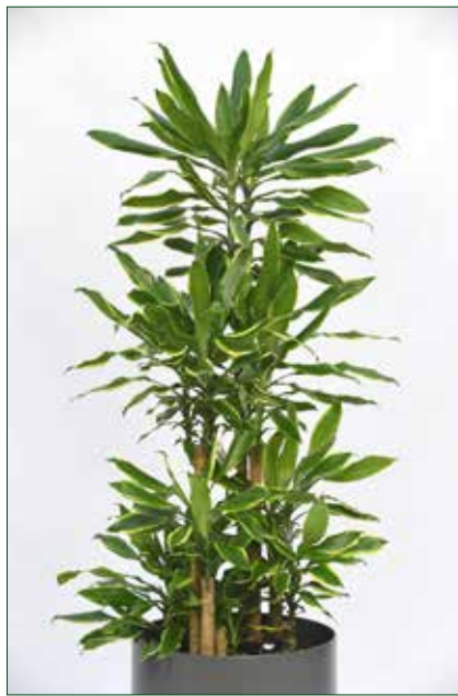
mittlerer Lichtbedarf, Dracaena Golden Coast 5.5.1.B18