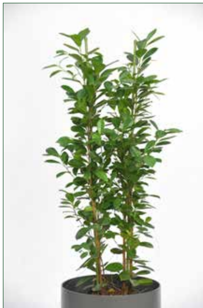
hoher Lichtbedarf, Ficus mollame 5.4.1.A31