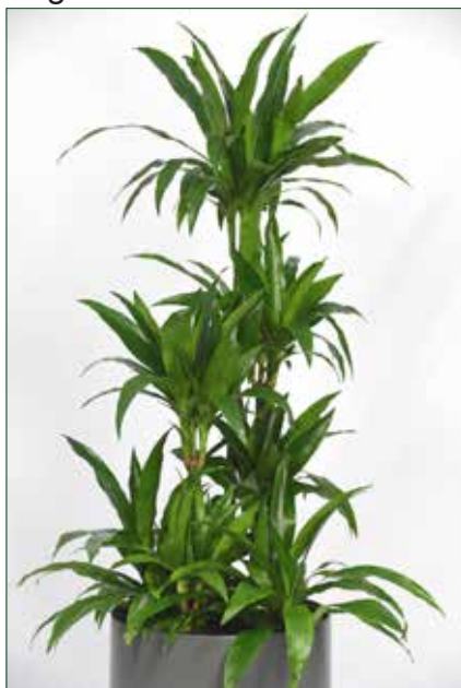
geringer Lichtbedarf, Dracaena Janet Craig 5.5.1.B6