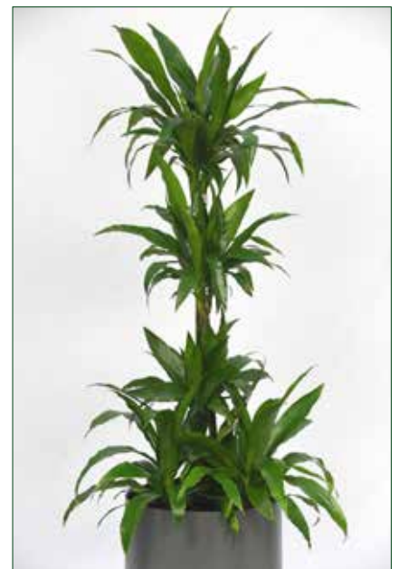
geringer Lichtbedarf, Dracaena Janet Craig 5.4.1.A4