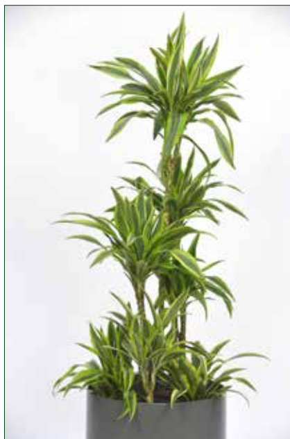
mittlerer Lichtbedarf, Dracaena lemon lime 5.5.1.B24