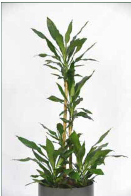
geringer Lichtbedarf, Dracaena fragans stednerii 5.4.1.A2