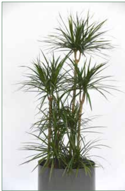
mittlerer Lichtbedarf, Dracaena marginata verzweigt 5.5.1.B26