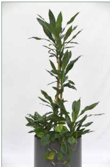
geringer Lichtbedarf, Dracaena fragans stednerii 5.5.1.B1

geringer Lichtbedarf ab Seite 19 mittlerer Lichtbedarf ab Seite 21 hoher Lichtbedarf ab Seite 23