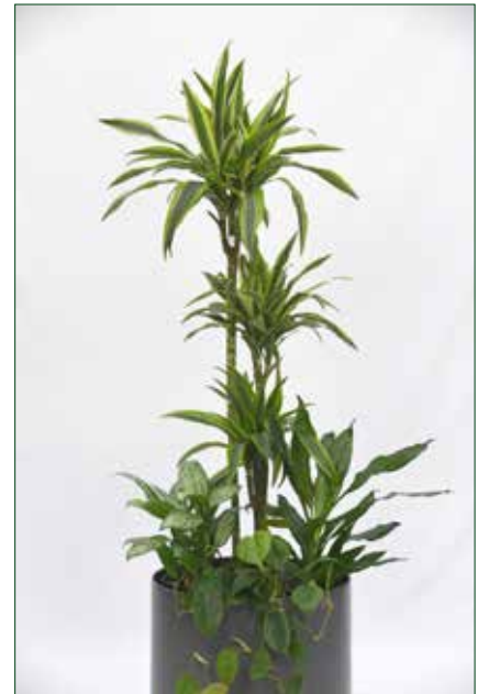
mittlerer Lichtbedarf, Dracaena lemon lime 5.5.1.B22