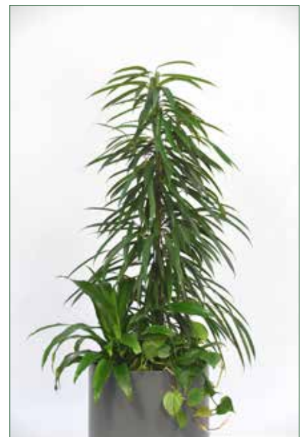
hoher Lichtbedarf, Ficus longifolium alii 5.4.1.A38