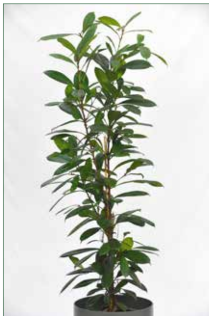
hoher Lichtbedarf, Ficus Cyathistipula 5.4.1.A29