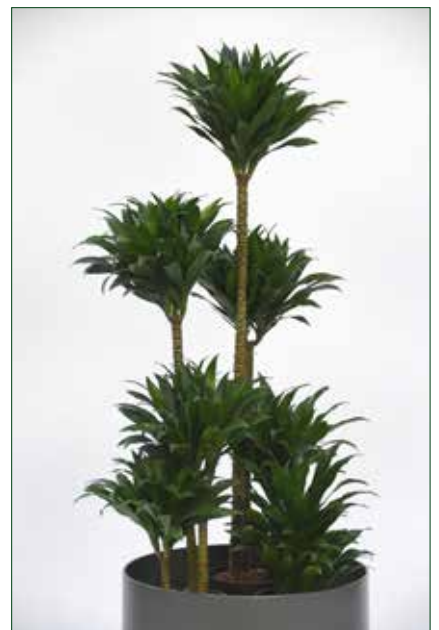
geringer Lichtbedarf, Dracaena Janet Craig compacta 5.5.1.B8